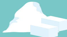
SUCRE BLANC DE CANNE (RAFFINÉ)

Le sucre de la canne est naturellement roux, en raison de pigments présents dans la tige. Ce sucre roux est la « cassonade ».