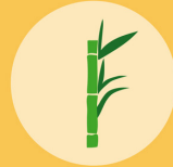
CANNE À SUCRE